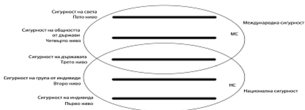
Илюстрация. 2. Схема на Петте нива на сигурността (Вертикален разрез на сигурността)

Последните три нива на сигурността (на държавата, на общността от държави и на света) определят Международната сигурност или по-точно обхващат с висока степен на пълнота и яснота обектите, които изучава Международната сигурност.